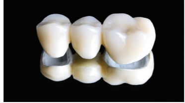
Kompozittal leplezett PEEK-ből készült 3 tagú implant híd