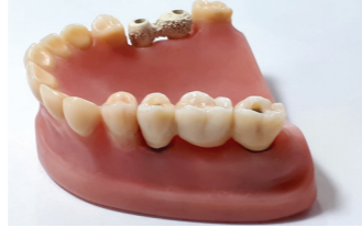
PEEK-ből készült „all on four overdenture”