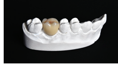
Kompozittal leplezett PEEK korona