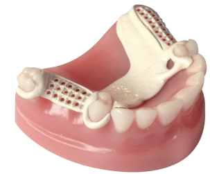
Kapcsos, fémentes lemezmunka PEEK-ből