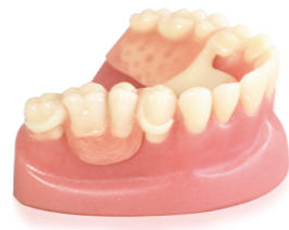
Akril fogak akriláttal leplezett acetál lemez munkán